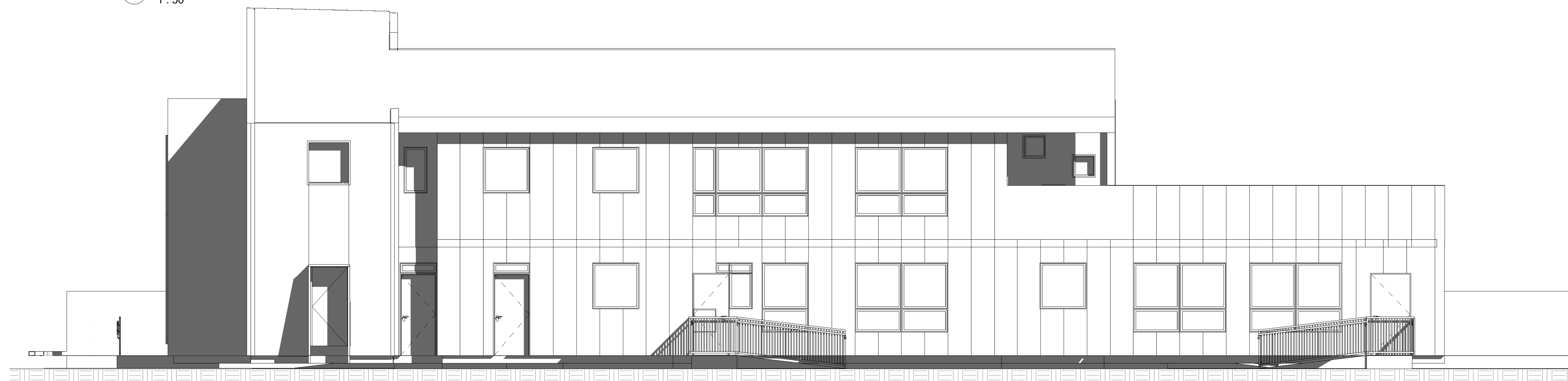
2 Elev oriente 1 : 50

CUALQUIER DISCORDANCIA O COMENTARIO A ESTE PLANO DEBE SER CONSULTADO CON LOS ARQUITECTOS LAS COTAS PREVALECEAN SOBRE EL DIBUJO Y DEBERÁN SER RATIFICADAS EN OBRA